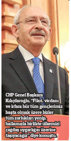
CHP Genel Başkanı Kılıçdaroğlu, "Fikri, vicdani ve irfanı hür tüm gençlerimiz başta olmak üzere bizler tüm zorlukları yenip, hallamızla birlikte ülkemizi çağdaş uygarlığın üzerine taşıyacağız" diye konuştu.