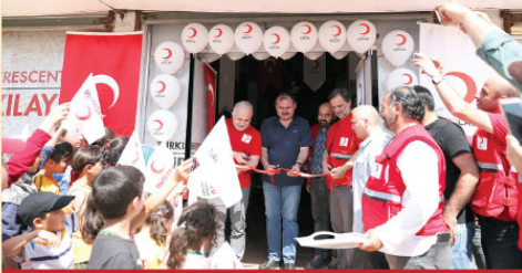
Türk Kızılay Başkanı Kerem Kınık Afrin'de Sevgi Butik Mağazası'nın açılışını yaptı.