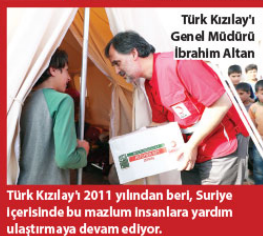
Türk Kızılay'ı 2011 yılından beri, Suriye içerisinde bu mazlum insanlara yardım ulaştırmaya devam ediyor.