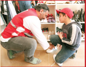
Butiklerin tamamı hiç kullanılmamış ürünlerden oluşuyor.