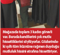
Mağazada toplam 3 kadın görevli var. Burada kendilerini çok mutlu hissettiklerini söylüyorlar. Gözetimdeki ışıltı tüm hüznüne rağmen duyduğu mutluluk hissini etrafına hissettiriyor.