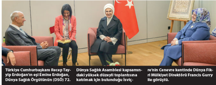
Türkiye Cumhurbaşkanı Recep Tayyip Erdoğan'ın eşi Emine Erdoğan, Dünya Sağlık Örgütü'nün (DSÖ) 72.

Emine Erdoğan, "Nasıl ki dünyanın gelişmiş ortak mirasımıza, geleceği ortak bakmamız gerekir. Oznaklı insan ve hassas durumlarda kadınların, çocukların ve gençlerin yaşam şartları, hepimizi ilgilendiriyor. 132 milyondan fazla insanı yardıma muhtaç