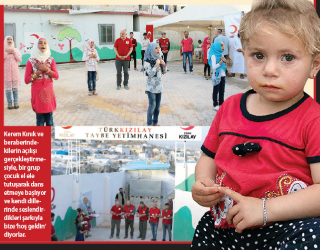
TÜRK KIZILAY TAYBE YETİMHANESİ