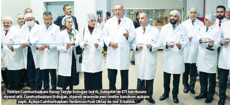
Türkiye Cumhurbaşkanı Recep Tayyip Erdoğan (sol 6), Eskişehir'de ETİ fabrikasını ziyaret etti. Cumhurbaşkanı Erdoğan, ziyaret sırasında yeni üretim bandının açılışını yaptı. Açılışa Cumhurbaşkanı Yardımcısı Fuat Oktay da (sol 3) katıldı.