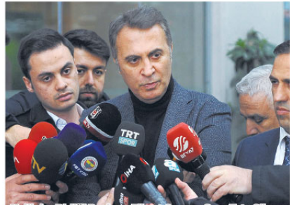
Kulüpler Birliği Başkanı Fikret Orman, Spor Toto Süper Lig'deki yabancı oyuncu kuralının gelecek sezon da aynı şekilde devam etmesini istediklerini söyledi.

Özel sporcularla ilgili de çok güzel çalışmalar yaptıklarını aktaran Bakan Mehmet Muharrem Kasapoğlu, "Engelli sporcuların yetiştirilmesi ve beden eğitimi öğretmenlerimizin yetkinliklerinin arttırılmasına yönelik bir çalışma yapıyoruz. Bugün Down Sendromlu Farkındalık Günü. Ona ilişkin çalışmalar devam ediyor. Gençlik merkezlerimiz de engellilere erişim noktasında önemli. Tematik gençlik merkezi açtık Mersin'de. Önemli bir çalışma. Çalışmalarımızın sınırı yok. Engelli sporcularına daha rahat ulaşım sağlama için özel otobüsler dizayn ettirdik. Engelli vatandaşlarla ilgili her branşta çalışmalarımız eğitim anlamında devam edecek. Özel eğitimli okullarda görevli öğretmenlerimizle ilgili bir kitap seti hazırladık. Onları ayrıca önemsiyoruz." dedi.