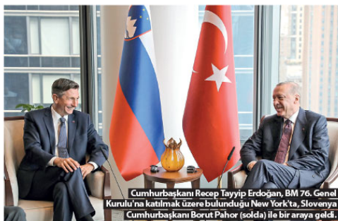
Cumhurbaşkanı Recep Tayyip Erdoğan, BM 76. Genel Kurulu'na katılmak üzere bulunduğu New York'ta, Slovenya Cumhurbaşkanı Borut Pahor (solda) ile bir araya geldi.

Erdoğan, ikili ticaret hacminin yıl sonunda 25 milyar dolara ulaşmasını beklediklerini belirterek, şöyle konuştu: "Biz, insanlarımızla birlikte salgın sonrası dönemi doğu şekilde değerlendiriyoruz. İki ülke dolar hedefimizi rahatlıkla ulaşacağımıza inanıyoruz. Ekonomik ve ticari ilişkilerimizin gelişmesinde artan karşılıklı yatırımların önemi bir rol buluyor. 2021 yılının Haziran ayı itibarıyla Türkiye'de faaliyet gösteren Amerikalı şirket sayısı 1971'e ulaştı. Amerika'nın Türkiye'deki doğrudan yatırımları 13 milyar doları buldu. Türk yatırımcıları da Amerika'da 7,2 milyar dolarlık doğrudan yatırım yaptı. Uygun maliyet ve geniş üretim imkanları, iyi eğitilmiş iş gücü ve modern lojistik altyapısıyla Türkiye, küresel ticarete giderek daha fazla ön plana çıkıyor. Ülkemiz salgın döneminin boyunca küresel ticaret zincirlerinin güvenli bir halkası olduğunu söyle-