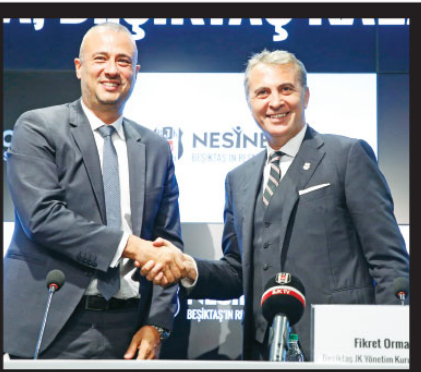
Fikret Orman Beşiktaş JK Yönetim Kurulu Başkanı