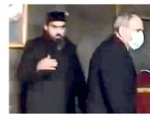
terk etmesini istedi. Paşinyan ıtraz etmeden kiliseden ayrıldı.

Ermenistan'ın Azerbaycan karşısında yenilgiyi kabul ettiği Dağlık Karabağ Anlaşmasına imza atıldıktan sonra Ermenistan Başbakanı Nikol Paşinyan'a tepkiler sürüyor. Ermenistan halkının istifasını istediği Başbakan Paşinyan, Ermeni askerleri için Sisian Aziz Grigor Kilisesi'nde düzenlenen taziyeye katıldı. Paşinyan, mün yakıtından sonra kilisedeki papaza yaklaştı ve elini sıkmaya çalıştı. Ancak tokalaşmayı reddeden Papaz, Paşinyan'dan kiliseyi