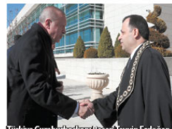
Türkiye Cumhurbaşkanı Recep Tayyip Erdoğan, Anayasa Mahkemesinde Üyeli Yemin Töreni'ne katıldı. Türkiye Cumhurbaşkanı Erdoğan, Anayasa Mahkemesi Başkanı Zühtü Arslan'la karşılaştı.

masına dayanmaktadır. Anayasa Mahkemesi olarak, Mevlana'nın pergel metaforundan müphem, bir aygıtın bu top rakamı değeri içinde sabit, diğer aygıtlarla tüm dünyaya aqlarak anayasal adaletini tesisi için çaba gösteriyoruz. Anayasamızın temel hak ve hürriyetlerin tam olarak korunması, karşılıklı anlaşma yargısında iyi uygulama örnekleri arasında yerini alan ideal bir anayasal denetimini derdini ve arzusunun taşıyoruz. Zira biliyoruz ki etkili bir anayasal denetimi demokratik hukuk devletinin varlığına devam ettirmesinde hayati bir işlev görmektedir." Başkan Zühtü Arslan'ın konuşmasını ardından yemin törenine geçildi. Öz geçmişi okunan yemin törenine Seferinoğlu da katıldı. Seferinoğlu'nun kısvesi Başkan Arslan tarafından giydirildi.