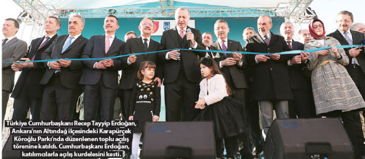
Türkiye Cumhurbaşkanı Recep Tayyip Erdoğan, Ankara'nın Altındağ ilçesindeki Karapürçek Koroğlu Parkı'nda düzenlenen toplu açılış törenine katıldı. Cumhurbaşkanı Erdoğan, katılımlarla açılış kurdelesini kestirdi.

"Milletle birlikte yaşamaya başladığımızdan beri Altındağ'ı, Altındağ'ın cesur, gayretli ve fedakar insanlarını hep yanımızda bulduk. Biz yalnız konuşmadık, şu ana gündüğümüz 14 seçim tamamladık, siz Altındağ'ın kardeşlerimiz çok güçlü desteğini aldık. Partimizin kurup ülkemizi için hizmet yolculuğuna başladığımızda Altındağ yüzde 50 ile 'Adalet ve Kalkınma' dedi. Vesayet odaklarının tüm güçleriyle üzerimize abandı. 2004'te Altındağ, 64,5 ile 'Demokrasi' dedi. Eski Türkiye heveslilerinin özellikle saldırdığı 2009'da Altındağ yüzde 57,3 ile 'Millî irade' dedi. İhanet çetesinin saldırılarının yoğunlaşığı