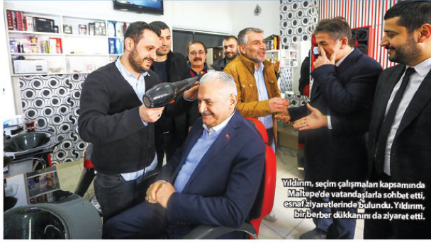
Yıldırım, seçim çalışmalar kapsamında Maltepe'de vatandaşlarla sohbet etti, esnaf ziyaretlerinde bulundu. Yıldırım, bir berber dükkanında da ziyaret etti.