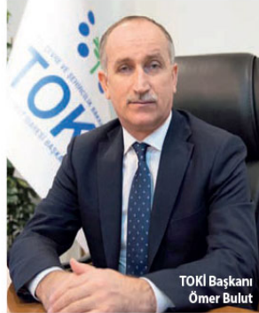
TOKİ Başkanı Ömer Bulut

TOKİ Başkanı Ömer Bulut, "67 ilde 140 projeye hayata geçirilecek 50 bin yeni sosyal konut projemiz için talep toplama tamamlandı. Projemize 636 bin 787 kişi başvurdu" dedi.