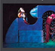
Devlet Tiyatroları Genel Müdürlüğü tarafından düzenlenen "Küçük Hanımlar Küçük Beyler Uluslararası Çocuk Tiyatroları Festivali" dünyadan ve Türkiye'den önemli çocuk oyunlarını 15'inci kez Ankara'da minik sanatseverlerle buluşturacak.

movaların Sibirya'dan, KTKC'den 'Tilki ile Kırpı', Bulgaristan'dan 'Doğmamış Kız', Hırvatistan'dan 'Wanda Lavanda', Rusya'dan 'Dinazor İgü' ve Almanya-Romanya ortak yapımı 'Leke' isimli çocuk oyunları sahnelenecek. Türkiye'den ise, Ankara Devlet Tiyatrosu, 'Tembel Memiş', 'Altın Kız', 'Mavi Kuş', 'Midas'ın Altınları' ve 'Papagan Kaçtı', İstanbul Devlet Tiyatrosu, 'Narnia Güllükleri'ni ve 'Bir Nefes Dede Korkut'u, Diyarbakır Devlet Tiyatrosu 'Çizmeli Kedi'yi, Antalya Devlet Tiyatrosu, 'Bremen Müzikacları'nın Hikâyesini', Sivas Devlet Tiyatrosu, 'Ayrıyıcı Sirk'i'ni, Trabzon Devlet Tiyatrosu, 'Sihirli Lambayı', Erzurum Devlet Tiyatrosu, 'Dünyanın Eski Zamanlarında'yı, Van Devlet Tiyatrosu 'Mikrobik ile Gribik'i ve Eskişehir Büyükşehir Belediyesi Tiyatroları 'Küçük Kara Balık'ı minik sanatseverlerin beğenisine sunacak. Festivalde ayrıca; kukla, gölge oyunu, dans tiyatrosu, opera ve bale, müzikal gibi farklı tekniklerin kullanıldığı çocuk oyunları, atölye çalışmaları gibi etkinlikler de gerçekleştirilecek.