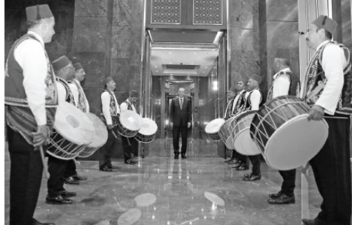
Cumhurbaşkanı Recep Tayyip Erdoğan, Cumhurbaşkanlığı Külliyesi’nde esnaf temsilcileri iftar programında bir araya geldi. Cumhurbaşkanı Erdoğan, salona gelisinde Karşılıklı davulcular tarafından karşılandı.

16 Nisan halk oylamasının olumlu şekilde sonuçlanmasında esnaf ve sanatkarların çok önemli rolü olduğuna inandığını söyleyen Erdoğan, “16 Nisan oylaması bitti ancak asıl bu oylamanın neticesi 2019 Kasım. Oraya hep birlikte çok yoğun çalışmalıyız. O seçimden sonraki süreç önemli. Türkiye bir yönetime sistemini değiştiriyor. Yeni dönemde bizler farklı bir hizmet yolunu açmış olacağız. Bunun yolunu açarken de ülkemizin çalışmasını etkinliğini farklı bir yere taşıyacağız” ifadelerini kullandı.