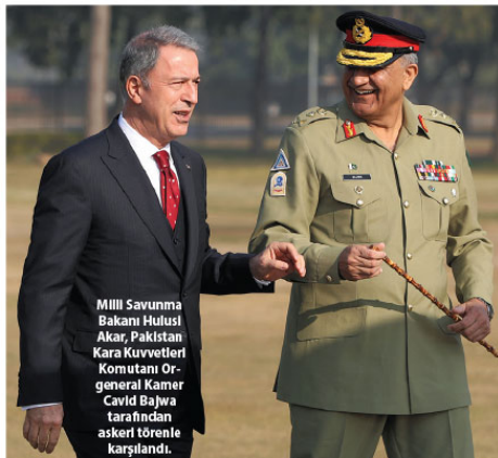
Milli Savunma Bakanı Hulusi Akar, Pakistan Kara Kuvvetleri Komutanı Orjeneral Kamer Cavid Bajwa tarafından törenle karşılandı.

"Bundan sonra bu çalışmalarımız, Katarlı kardeşlerimizle birlikte geliştirerek devam ettireceğiz. Türkiye'nin etrafında çok ciddi sorunlar var, bunları yakından takip ediyoruz. Ülkeyi birliği, bütünlüğü, egemenliği, bağımsızlığı, huzuru, barışı, istikrarını sürdürmek için bu görevi üstlenmişiz. Silahlı Kuvvetlerin mensupları, bu konuda hiçbir ülkenin göstermediği dikkati, hem faaliyetlerin planlanmasında hem de ıcrasında göstermişler. Şimdi önümüzde Münbiç ve Fırat'ın doğusu var. Bu konuda da