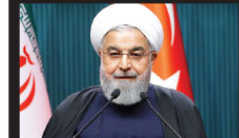
İRAN CUMHURBAŞKANI HASAN RUHANI

"Siyasi ilişkilerimizin ekonomik, sosyal ve kültürel ilişkilerle desteklenmesi her iki ülke halkının da yararına olacaktır. İkili ilişkilerimizin tüm boyutlarının hak ettiği seviyeye ulaşması için Türkiye olarak üzerimize düşenleri yapmaya hazırız. Bu yolda siz iş dünyamızla da bizimle beraber yürümesini istiyoruz. Sizlerden iki ülkenin potansiyelinden tam anlamıyla istifade edecek projelerle iş birliği geliştirmenizi bekliyoruz. Bu ziyaretin günlerinde deki dostluk ağacımızın büyümesine, düşmanlık fidanlarını söküp alınmasına vesile olduğuna inanıyoruz."