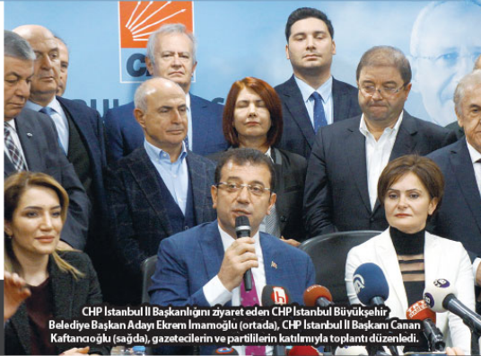
CHP İstanbul İl Başkanlığı ziyaret eden CHP İstanbul Büyükşehir Belediye Başkan Adayı Ekrem İmamoglu (ortada), CHP İstanbul İl Başkanı Canan Kaftancıoğlu (sağda), gazetecilerin ve partililerin katılımıyla toplantı düzenledi.

60'ın üzerinde 'Bir fırsat bulsam bu ili terk ederim' demeyeceği bir İstanbul... İstanbul'da herkesin mutlu olduğu derken, önce çocukların geleceğe umutla baktığı, kadınların mutlu ve özgür biçimde bu kenti yaşadığı bir İstanbul... İnsanca yaşamın olduğu, herkesin bu dünya kenti, on binlerce yıllık derinlikten gelen, bütün o derinliğin sorumluluğunu taşıyan yöneticiler var olduğu bir İstanbul... İstanbul'u yönetirken, İstanbul'u düşünen yönetimin olduğu bir İstanbul Büyükşehir Belediyesi... Her şeyden önce Türkçemizi ve İstanbulumuzu en fazla