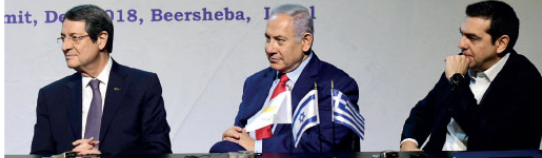
İsrail, Yunanistan ve Güney Kıbrıs Rum Yönetimi (GKRY) arasında düzenlenen 5. Üçlü Zirve, İsrail Başbakanı Netanyahu'nun (ortada) ev sahibliğinde, İsrail'in Barış Sebi (Beer Seva) kentinde yapıldı. Zirveye Yunanistan Başbakanı Aleksis Cıpras (sağda) ve Güney Kıbrıs Rum yönetimi lideri Nikos Anastasiadis (solda) katıldı.

iversitesi (DÜ), Doğu Marmara Kalkınma Ajansı (MARKA) ve Yeşilay tarafından "Kamu Politikalarında Başgüçlük Mücadele" başlığında düzenlenen Uluslararası Kamu Politikaları Sempozyumu başladı. DÜ Cumhuriyet Konferans Salonu'nda gerçekleştirilen sempozyuma konuşan Ersoy, önemli bir konuda akademisyenler ve öğrencilerle birlikte olmakta memnuniyet duyduğunu söyledi.