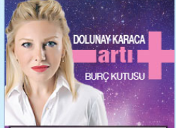
DOLUNAY KARACA arti BURÇ KUTUSU

TERAZİ: Sevdiği Teraziler, çocuklarla ilişkileriniz güzel geçiyor, her türlü faaliyet ve aktiviteler için uygun bir gündesiniz. Aşk flirt konularında iletişim aksaklıkları olabilir.