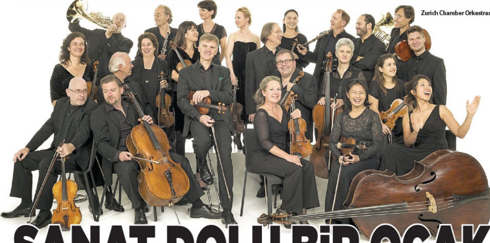
Zurich Chamber Orkestrası