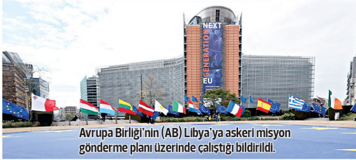
Avrupa Birliği'nin (AB) Libya'ya askeri misyon gönderme planı üzerinde çalıştığı bildirildi.

Büksel merkezli EUobserver sitesinin haberine göre, AB söz konusu misyon vastasıyla Libya'daki diğer güçlerle rekabet ederek nüfuz sahibi olmayı amaçlıyor.