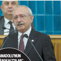
"ANADOLU'NUN İCİNİ BOŞALTILIR"

"İşsiz katederimse soteriyorum: 17 yıldır iktidarlar, onları çoktan işsiz değil, onları çoktan bir eli yada bir eli kaldı. Ümin çoktan işsiz Fakirin, fakirlerin, gariblerin, arkas olmanın çoktan işsiz. Sen halde oyumu ona veriyorsan, yanı ağzındaki lokmayı da alır, bundan hiç endişe olmasın. Bunlar iktidar olmadık önce Anadolu kaplanları diye bir lar vardı. Anadolu'yu ayağa kaldıranlar vardı. Kaplan kalmadı, Anadolu'nun işini boşaltılar.