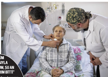
Türk bilim insanları, kapalı ameliyat tekniğiyle minimal invaziv kalp cerrahisiyle, iki yapraklı kalp kapakçığı bulunan ve kalpten çıkan ana damarda balonlaşma (aort anevrizması) olan hastaya, biyolojik kalp kapağı ve biyolojik damar kullanılarak müdahale edildi.

Durdu, aort anevrizmasında damar duvarının incelerek yırtılabildiğini belirterek, bu durumda müdahaleye geç kalınması halinde kişinin saatler içinde hayatını kaybedebileceğini dikkati çekti.