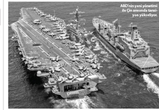
ABD'nin yeni yönetimi ile Çin arasında tansiyon yükseliyor.

Terör örgütleri DEAŞ ile PYD-YPG'nin birbirlerine silah sattıkları yönelik soruya da Çavuşoğlu, şöyle cevapladı: Suriye'de değişik gruplar arasında ticaret var, yarıdlaşma var. Bir taraftan da birbirlerini öldürüyorlar. Verilen silahların bile yarınsın DEAŞ'a yarınsın da YPG'ye gittiğini görüldük. Zaten YPG'nin eline silahın geçmesi demek PKK'nın eline geçmesi demektir. Bunun operasyonlarda görüyoruz, yakalıyoruz bu silahları. YPG ile DEAŞ'ın esasen birbirine karşı güç mücadelesi yapıyor. Suriye'nin geleceği için değil, ikisi de birbirinden toprak almaya çalışıyor ama yer yer birbirinden silah alıyorlar, değişiyorlar, satıyorlar. Petrol dahil birbirleriyle ticaretleri var. Bunu da zaten herkes biliyor. Bugün de YPG'ye silah vermenin tehlikesini ve risklerini ön plana çıkarmaya, herkesin dikkatine getirmeye çalışık.