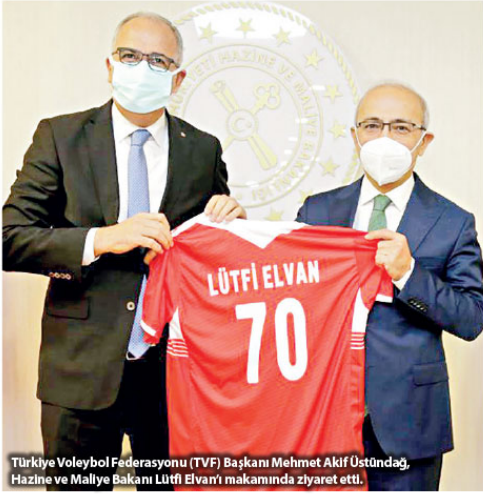
Türkiye Voleybol Federasyonu (TVF) Başkanı Mehmet Akif Üstündağ, Hazine ve Maliye Bakanı Lütfi Elvan'ı makamında ziyaret etti.

Bu platformda herhangi bir şahıs olmadığının işaret eden Elvan, sözlerini şöyle sürdürdü: "Feki döviz alım-satım işlemlerinde tarafırlar birbirlerini bilmiyorlar mı? Hayır, kesinlikle tarafırlar birbirlerini bilmiyorlar, kimin ne kadar aldığını karşı taraf bilmiyor, bu işlem gerçekleştirildikten sonra kimin ne aldığını, hangi bankanın ne aldığını görebiliyorsunuz. Burada bir döviz satım işlemi gerçekleştirilmesinde diyetim ki Türkiye'deki yerli ve yabancı bankamız o günkü kur üzerinden belirli miktarda alım işlemi gerçekleştirilmiş ve bunun karşılığında Merkez Bankası'nın Türk lirası ödemesi gerçekleştirilmiştir. Dolayısıyla şunu özellikle vurgu-