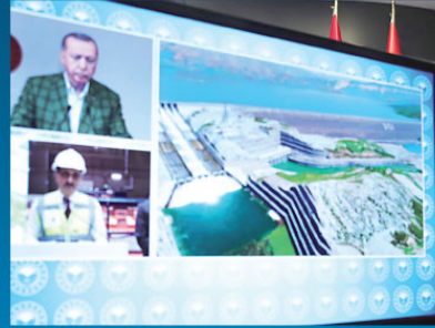
Cumhurbaşkanı Erdoğan, İlisu Barajı Enerji Santrali 1. Tribün Devreye Alınma Töreni'ne video konferans yöntemiyle katıldı.

"Bölücü teröre boyun eğmediğimiz gibi sokak terörüne de asla müsaade etmeyeceğiz." ifadelerini kullanan Cumhurbaşkanı Erdoğan, "Kendi ülkesini yabancılara şikayet edenlere, kendi halkına silah çekenlere, kendi insanının kanını dökenlere kanını verdikimiz en güzel cevap işte, bu muhteşem eserdir." dedi.