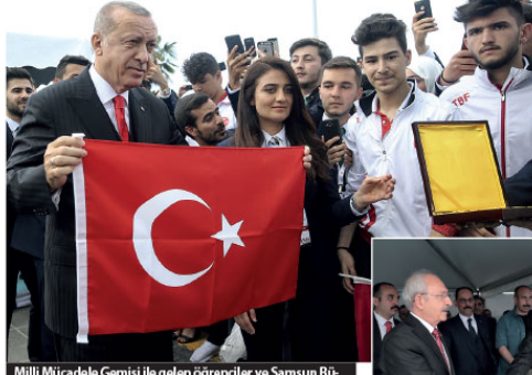
Millî Mücadele Gemisi ile gelen öğrenciler ve Samsun Büyükşehir Belediyesi Dragon Bot Kürek Takımı 81 ilden getirdikleri toprak ve bayrağı Türkiye Cumhurbaşkanı Recep Tayyip Erdoğan'a takdim etti.

Cumhurbaşkanı Erdoğan, son altı yılda yaşanan badirelerin Türkiye'nin enerjisini ve kaynaklarını mecburen krizleri çözmeye yönelttiğini, her şeyi rağmen 2023 hedeflerine bağlı kaldıklarını anlatarak, Cumhurbaşkanlığı bağli bünyesinde kurulan özel ekibin bakanlıklardan belediyelere kadar tüm kamu kurumlarının performanslarını çeyrek dilimlere hâlinde izleyip, raporladığını bildirdi. Cumhurbaşkanı Erdoğan, "Güvenlikte