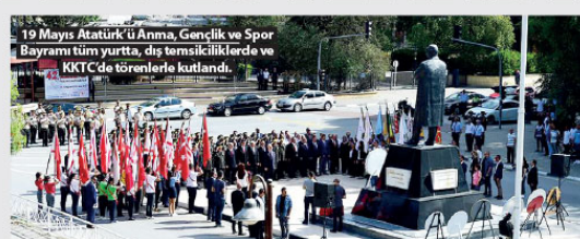
19 Mayıs Atatürk'ü Anma, Gençlik ve Spor Bayramı tüm yurtta, dış temsilciliklerde ve KKT'de törenlerle kutlandı.

Törenin ardından, Atatürk'ün Samsun'da ilk adımı attığı yer temsili eden Tütün İskelesinde program yapıldı. Deniz Kuvvetleri Atatürk Rallisı kapsamında İstanbul'dan 16 Mayıs'ta yola çıkan yelkenli su takımı ile karşılandı. Sahil Güvenlik Komutanlığı gemisinin geçişinin ardından, İskeleden bayrak çöküşü yapıldı.