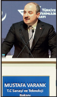
MUSTAFA VARANK T.C. Sanayi ve Teknoloji Bakanı

Coğrafi işaretli ürünlerin ortak üretimi, satışı ve pazarlanması, bunların turizm değerine dönüştürmesi gibi önceliklere destek vereceğiz." TESCİLDE ULUSLARARASI İŞ BİRLİKLERİ "Coğrafi işaretli ürünlerin ihracatını artırmak için, yurt dışında da tescil edilmelerinin sağlanması gerekiyor. Bu amaçla TÜRKPA-TENT, Avrupa Birliği Komisyonu ile iş birliği yapıyor. Halihazırda AB ile Antep baklavası, Aydın inciri, Malatya kaysısı olmak üzere 3 tescilimiz var. Bu tesciller sayesinde, ürünlerimizi AB'ye daha fazla ihraç etmeyi amaçlıyoruz. Ayrıca oradaki kötüye kullanım ve taklitleri engellemeye çalışıyoruz. Diğer taraftan da ürünlerimizin kalitesini prestij anlamında göstermiş oluyoruz. İlimizde yürürlüğe giren iş birliği kapsamında, ilimde 35 başvuruyu daha tescil ettirmeye hedefliyoruz. Bir başka uluslararası iş birliğimiz de Birleşmiş Milletler Gıda ve Tarım Örgütü ile başlatılıyor. Coğrafi işaretlerimizin ticarileşmesi ve denetim şartlarının iyileştirilmesi anlamında ortak çalışma yapacağız. Ayrıca proje kapsamında, Türk cumhurbaşkanının coğrafi işaret kapasitesinin artırılmasına yönelik çalışmalarımız da olacak. Özbekistan, Azer-