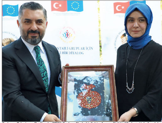
Radio ve Televizyon Üst Kurulu (RTÜK) Başkanı Eubekir Şahin, Avrupa Birliği (AB) desteğiyle Anadolu İletişim ve Eğitim Derneği (ANİLDER) ve COPE (Cooperazione Paesi Emergenti) tarafından "Dezavantajlı Gruplar İçin Yeni Bir Diyalog Projesi" çerçevesinde düzenlenen "Nar Buluşmaları"nın konuştuğu oldu.

"İstatistik verileri göre, yoğun şiddet sahnelerinin bulunduğu diziler çok izleniyor, bir o kadar da çok şikayet alıyor. Çok izlenen dizilere çok fazla şikayet bildirimi geliyor. Çok izlenen dizi çok şikayet ediyor.