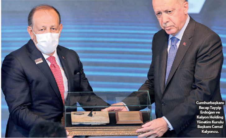
Cumhurbaşkanı Recep Tayyip Erdoğan ve Kalyon Holding Yönetim Kurulu Başkanı Cemal Kalyoncu.

Cumhurbaşkanı Recep Tayyip Erdoğan, cuma günü verecekleri müjde ile Türkiye'de yeni bir dönemin açılacağını söyledi.