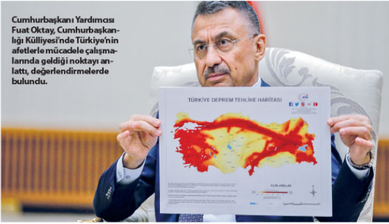
Cumhurbaşkanı Yardımcısı Fuat Oktay, Cumhurbaşkanlığı Külliyesi'nde Türkiye'nin afetlerle mücadele çalışmalarında geldiği noktayı anlattı, değerlendirmelerde bulundu.

"17 Ağustos'ta kendi Bakanlar Kurulu üyeleriyle bile iritab sağlayamayan bir hükümetten ve depreme müdahale anlamında sahaya inemeyen bir hazırlıksız süregelen bugün dünyamız en iyi sistemine sahip olan, sadece Türkiye'deki kendi vatandaşına bir şey olduğu zaman değil, dünyanın neresinde olursa olsun amanda hareket geçebilen ve oraya ulaşabilen bir Türkiye'den bahsediyoruz. 17 Ağustos'tan bugüne muhteşem bir fark var. Burada Sayın Cumhurbaşkanımızın çok güçlü liderliği, derinleşen çok önemliydi. Ben AFAD Başkanlığı yapan bir arkadaşımın net olarak ifade ediyorum, Cumhurbaşkanımızın net