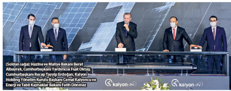
(Soldan sağa): Hazine ve Maliye Bakanı Berat Albayrak, Cumhurbaşkanlığı Yardımcısı Fuat Oktay, Cumhurbaşkanlığı Yardımcısı Recep Tayyip Erdoğan, Kalyon Holding Yönetim Kurulu Başkanı Cemal Kalyoncu ve Enerji ve Tabii Kaynaklar Bakanı Fatih Dönmez

Güneş paneli üretiminin tüm aşamalarını gerçekleştirecek Kalyon Güneş Teknolojileri Fabrikası, üretimin en önemli aşamalarından biri olan ingot üretimini de gerçekleştirecek Avrupa ve Ortadoğu'da bu üretilen ingot ile tek fabrika olacak. Güneş paneli üretiminin dört aşamasından ilki olan ingot üretimi üstün teknoloji ve bilgi gerektiriyor. Hammade formundaki polisilyum, yaklaşık 1450°C sıcaklıkta eritilerek mono-kristal silisyum ingot şeklini alıyor. Üretilen küller, saniyede 15 metre hızla sahip elmas kaplı tel testereyle yarılmaya 180 mikrometre kalınlığındaki dilimleniyor. 30'dan fazla kimyasal ve fiziksel yan ilekten üretim sürecinden geçen silisyum dilimlerin fotovoltaiik güneş hücreleri için kullanılır.