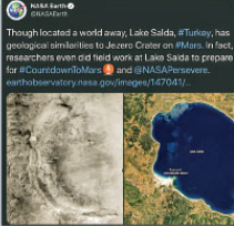
NASA Earth@JPL Though located a world away, Lake Salda, a Turkey, has geological similarities to Jezero Crater on Mars. In fact, researchers even did field work at Lake Salda to prepare for #LiquorlandMars and @NASAPersevere. #earthtoinspiremars #mars #persevererobot