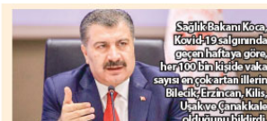
Sağlık Bakanı Koca, Covid-19 salgınında geçen haftaya göre, her 100 bin kişiye vaka sayısını en çok artan illerin Bilecik, Erzurum, Kilis, Uşak ve Çanakkale olduğunu bildirdi.

Kremlin'in açıklamasına göre Putin ve Erdoğan, Suriye'de bulunan uluslararası terörist gruplar ile taviz verilmemesi mücaadele edilmesinde görüşüne bağlı olduklarını da teyit ettiler. Bunun yanında İKİ lider, Libya'da uzun süreli normalleşme sağlanmasına adına Birleşmiş Milletler'in yardımı ile bu ülkede geçiş hükümetleri oluşturulmasının önemli üstünde durdu. Ülkeleri arasındaki ortak enerjili projelerinin ilerleyişini de ele aldılar, temasta kalacakları konusunda anlaştı. Rusya Devlet Başkanı'nun, Kuzey Irak'ta 13 Türk vatandaşının hayatını kaybetmiş olması nedeniyle Cumhurbaşkanı Erdoğan'a taziyte dileklerini ilettiği de kaydedildi.