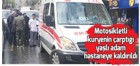
Motosikletli kuryenin çarptığı yaşlı adam hastaneye kaldırıldı

HIZ KISITLAMASI GETİRİLMELİ Siparişi hızlı teslim etmek için kendi camları dahil tüm yayaalan tehlikeye atan motosikletli kuryeler, vatandaşların tüm uyarılarına rağmen son hızla araçlarını kullanmaya devam ediyor. Vatandaşlar, hemen her hafta yaşanan motosikletli kurye kazalarının azalması için araçlarına hız limiti getirilip, uymayanlara gerekli cezaların verilmesi gerektiğini belirterek yetkililerle makamların bu konudaki yaptırımını bekliyor.