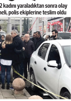
Adapazarı ilçesinde 2 kadını yaraladıktan sonra olay yerinden kaçan şüpheli, polis ekiplerine teslim oldu

ne sağlık ve polis ekipleri sevk edildi. Yaralılardan biri olay yerine gelen 112 Acil Servis ekiplerince, diğer yaralı ise yakınları tarafından Sakarya Üniversitesi Eğitim ve Araştırma Hastanesine kaldırıldı. Yaralıların durumunun ciddiyetini koruduğu öğrenildi. Olayın ardından kaçan şüpheli P.T.'nin, "155 Polis İmdat Hattı"ni arayarak Arifiye ilçesinde polis ekiplerine teslim olduğunu ve Asayiş Şube Müdürlüğüne getirildiği belirtildi.