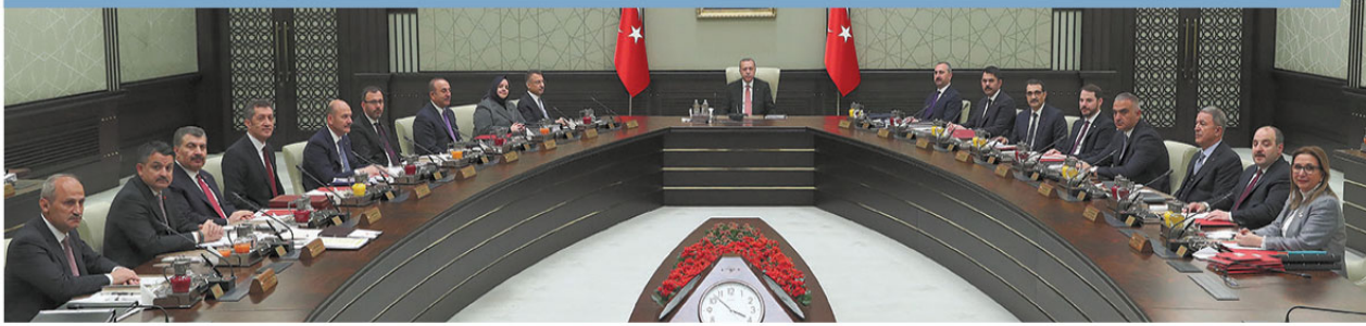
Cumhurbaşkanlığı Kabinesi, Türkiye Cumhurbaşkanı Recep Tayyip Erdoğan başkanlığında Cumhurbaşkanlığı Külliyesinde toplandı. Toplantıya (sağdan sola) Ticaret Bakanı Ruhsar Pekcan, Sanayi ve Teknoloji Bakanı Mustafa Varank, Millî Savunma Bakanı Hulusi Akar, Kültür ve Turizm Bakanı Mehmet Nuri Ersoy, Hazine ve Maliye Bakanı Berat Albayrak, Enerji ve Tabii Kaynaklar Bakanı Fatih Dönmez, Çeire ve Şehircilik Bakanı Murat Kurum, Adalet Bakanı Abdülhamit Gül, (soldan sağa) Ulaştırma ve Altyapı Bakanı Mehmet Cahit Turhan, Tarım ve Orman Bakanı Bekir Pakdemirli, Sağlık Bakanı Fahrettin Koca, Millî Eğitim Bakanı Ziya Selçuk, İçişleri Bakanı Süleyman Soylu, Gençlik ve Spor Bakanı Mehmet Muharrem Kasapoğlu, Dişçileri Bakanı Mevlüt Çavuşoğlu, Aile, Çalışma ve Sosyal Hizmetler Bakanı Zehra Zümrüt Selçuk da katıldı.