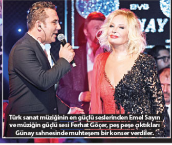
Türk sanat müziğinin en güçlü seslerinden Emel Sayın ve müziğin güçlü sesi Ferhat Göçer, peş peşe çıktıkları Günay sahnesinde muhteşem bir konser verdiler.

Sahneye ilk çıkan İslim olan Yeşilçam'ın Mavi Boncuk lakaplı yıldızı Emel Sayın, şarkıları ile kendisini dinlemeye gelen müzikseverleri geçmişten bugüne müzikal bir yolculuğa çıkardı. Dillerde dolanan şarkılarını hayranları için seslendiren başarılı sanatçı, performansının son bölümünde sahneye gelip kendisine süpriz yapan Ferhat Göçer'le muhteşem bir düete imza attı.