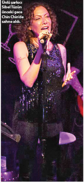
Ünlü şarkıcı Sibel Tüzün önceki gece Chin Chin'de sahne aldı.

Ziynet Sali ve Gökyaz Özman prodüktörlüğünde yeni şarkı çalışmaları içinde olan "Ezgi" yakın tarihte sevenlerini şaşkıncak bir projeye yeniden müzikseverlerle buluşturacak.