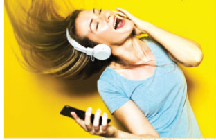
Katılımcıların çoğunluğu 18-34 yaş arasındaydı.