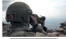
Şanlıurfa'da bir terörist, güvenlik güçlerinin ikna çalışması sonucu teslim oldu.

Terör örgütü PKK/YPG içerisinde faaliyet gösteren örgüt mensuplarının teslim olmalarını sağlanması amacıyla ikna çalışmaları sürüyor.