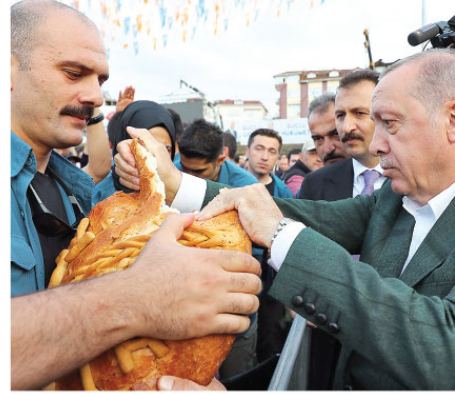
Tayyip Erdoğan, partisinin Ordu'da 19 Eylül Stadyumu'nda düzenlenen mitinge katılarak vatandaşlara hitap etti. Cumhurbaşkanı Erdoğan'ın ekmeğe ikram edildi.

Bay Muharem hiç anlamaz. Onlar varnsın kendi iplerinde devam etsinler. Biz ise hem terübe hem bugüne kadar ortaya koyduğumuz tavırlarla zaten kendimizi ispatladık. Biz bu kararlılıkla yola devam ediyoruz. Türkiye'nin büyük bir devlet ama büyük devletler küçük düşünmez, onlar büyük düşünür."