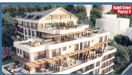
Kuleli Evleri Poyraz II

Türkiye'de henüz çok yaygınlaşmayan, sadece yeni konut projelerinde görülen akıllı ev sistemleri Avrupa ve Amerika'nın bazı bölgelerinde de sistem zorunlu hale getirildi. Kontrol, enerji verimliliği, yaşam kalitesi, bütçe tasarrufu gibi konuların önemle ilhamına sağlanan akıllı ev sistemleri kullanıcıların hayatını kolaylaştırırken kaliteli bir yaşam sürme imkânı tanıyor.