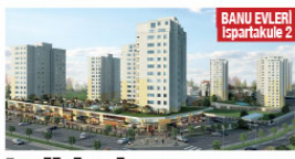
BANU EVLERİ İspartakule 2