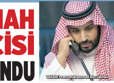
Velihaht Prens Muhammed Bin Selman

Daha önce Yemen'deki Suudi Arabistan öncülüğündeki askeri müdahalenin sözcülüğünü yapan Ge-