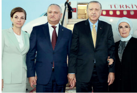
Cumhurbaşkanı Recep Tayyip Erdoğan ve eşi Emine Erdoğan, havalimanından Moldova Cumhurbaşkanı Igor Dodon ve eşi Galina Dodon tarafından uğurladı.

Moldova'daki resmî temaslarını tamamlayan Cumhurbaşkanı Erdoğan, başkent Kişinev'e geçerek Türkiye'ye hareket etti. Cumhurbaşkanı Erdoğan ve eşi Emine Erdoğan, Kişinev Uluslararası Havalimanı'nda Moldova Cumhurbaşkanı Igor Dodon ile eşi Galina Dodon tarafından uğurlandı.