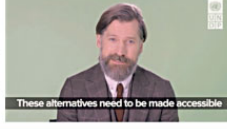
These alternatives need to be made accessible

Raporu 2020 küresel lansmanında yayınlandı. İklim eylemine karşı yayınlanan videoda yer almakta gurur duyduğunu belirten Şahika Ercümen videoda "Gezegeminizin haklarını ve güzelliklerini korurken, doğanın gücünden yararlanmayı öğrenmeliyiz. Ekosistemleri refahı artıracak şekilde korumalı, sürdürülebilir bir şekilde yönetmeli ve eski haline getirmek için harekete geçmeliyiz." ifadelerini kullandı.