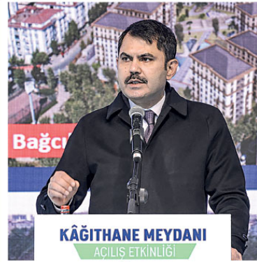
KÂĞİTHANE MEYDANI AÇILIŞ ETKİNLİĞİ

dediğini iki ülke arasındaki iş birliğinin ticari anlamda da belirli seviyeye gelecek, "gerçekten stratejik iş birliğimiz, dostluğumuz var" diyebilirim gerektiğini düşündüğünü aktardı. Ticari konularda geri kaldık. İki ülkenin de potansiyel ortada. İnşallah daha önce ifade edilen 100 milyar dolarlık ticaret hacmini yakalayabiliriz. Zaten bu konuları yakaladığımız takdirde diğer sorunlarımız da bir şekilde çözülebileceğine inanıyorum."