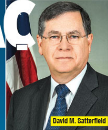
David M. Satterfield

ABD'nin Ankara Büyükelçisi David Satterfield, "Halihazırda 1.700'den fazla Amerikan şirketi Türkiye pazarında. Bu şirketlerin 70 bin çalışana buluyor. Hepimiz için Türkiye-Amerikan ilişkilerinin on yıllardır devam eden iş birliğinin geliştirilmesi çok önemli" dedi.