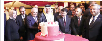
TBBM Başkanı Yıldırım, Cumhurbaşkanlığı Sözcüsü Katrı, Gençlik ve Spor Bakanı Kasapoğlu ve Büyükelçi el-Şafi'i kutlama pastasını kesti.

TBBM Başkanı Binali Yıldırım, "Türkiye ile Katar bugüne kadar birbirinin daima kara gün dostu olmuştur. Bundan sonra dostluğumuz bu minval üzerine devam edecektir" dedi.