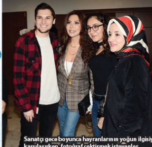
Sanatçı gece boyunca hayranlarının yoğun ilgisiyle karşılaşırken, fotoğraf çekilmek isteyenler tarafından sık sık durduruldu.