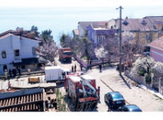
İstanbul Silivri'de kiraladıkları evin altında define aramak için kazı yapan iki kardeş, göçük altında kaldı.

Edinilen bilgilere göre olay, Silivri Gümüşyaka Mahallesi'nde yaşandı. Kiraladıkları evin altında define aramak için yaklaşık 150 metre tünel kazın iki kardeş, göçük altında kaldı. Olay yerine itfaiye ve AFAD ekipleri ve iş makineleri sevk edildi. İki kardeşi arama kurtarma çalışmaları dün gece saatlere kadar devam etti.