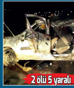
2 ölü 5 yaralı

Edinilen bilgiye göre Gaziantep'ten Kilis'teki evlerine seyahat halinde bulunan Mustafa Aydoğdu idaresindeki 27 DN 207 plakalı otomobil, Şahinbey İlçesi Bağlarbaşı Mahallesi Kils yolu bağlantı noktasında virajı alamayarak takla attı. Önceki sabah saat 04.00 sıralarında meydana gelen feci kazada sürücü olay yerine yaşamını yitiren, araçta bulunan Nazlı Salihdeliçay ise kaldırıldığı 25 Aralık Devlet Hastanesinde tüm müdahalelere rağmen kurtarılamadı. Otomobilde bulunan ve Nazlı Salih Deliaçay'ın çocukları olan 6 yaşındaki Talha Demir ile 2 yaşındaki Samet Deliaçay ise Gaziantep Gengiz Gökçek Kadın Doğum ve Çocuk Hastalıkları Hastanesine kaldırılarak tedavi altına alındı. Aynı otomobilde bulunan Ercan Özkesecik (26), Nadide Samanoğlu (47), Remziye Özkesecik (59) de kentteki çeşitli hastanelere kaldırılarak tedavi altına alındı.