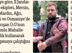
42 suçtan aranan zanlıya suçüstü

Adana'da tehdit, dolandırıcılık ve hırsızlık gibi 42 suçtan aranan şüpheli, yaşlı kadının 8 inek ve 80 koyununu dolandırıcılık yöntemiyle almaya çalışırken yakalandı.