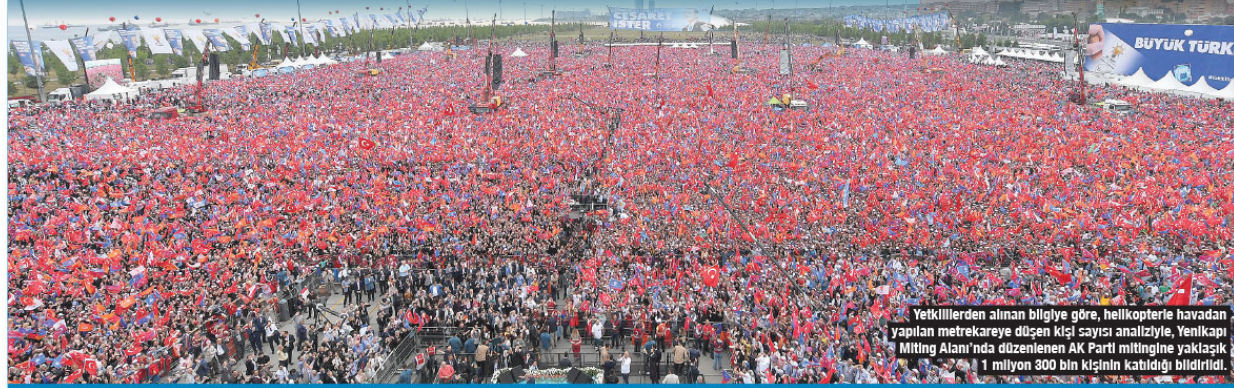
Yetkililerden alınan bilgiye göre, helikopterle havadan yapılan metrekareye düşen kişi sayısı analizyle, Yenikapı Miting Alanı'nda düzenlenen AK Parti mitingine yaklaşık 1 milyon 300 bin kişinin katılımı bildirildi.