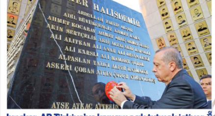
Juncker: AB Türkiye'ye kapısını açık tutmak istiyor

15 TEMMUZ Şehitler Abidesi'nin açılışında konuşan Cumhurbaşkanı Erdoğan, "Destanların tek bir kahramanı olur, 15 Temmuz'un ise milyonlarca kahramanı var" dedi.