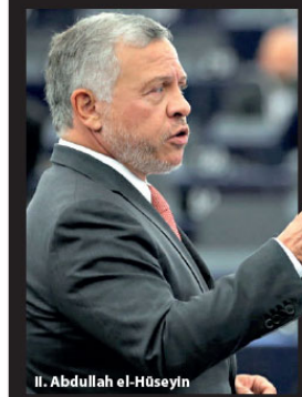
Il. Abdullah el-Hüseyn

Avrupa'nın mülteciler konusunda ülkesini yeterince desteklemediğini belirtti. Ürdün Kralı 2. Abdullah, Türkiye'yi örnek göstererek yaptığı açıklamalarında "Biz mültecileri göndeririz diye Avrupa'yı tehdit etmiyoruz" dedi.