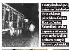
1968 yılında ağşap vagonlar Galata'daki bina yıkılarak çıkarıldı ve Galata Köprüsü'nden Sirkeci'deki araba vapuru iskelesine, oradan da özel bir araba vapuruyla Harem'e götürüldü.