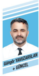
Güngör YAVUZARSLAN + GÜNCEL

sına neden oldu. Elde ettiği dış destek ile kendi halkına kurşun sılmaya başladı. Hafter'in saldılarını başlattığı 4 Nisan'dan bugüne kadar 400'den fazla sivil ölmeye üzere 2500'e yakın insan hayatını kaybetti, yaklaşık 500 bin Libyalı ise ülke içinde yer değiştirmek zorunda kaldı. 200 bin Libyalı ise savaş şartlarından ülkesini terk etti. General Abdulfettah Sisi, Mısır'da seçimlerle gelen seçilmiş Cumhurbaşkanı Mursi'yi 1 Temmuz 2013'te askeri darbe ile devirdi. Ülkede meydana gelen olaylarda yüzlerce sivil yaşamını yitirdi. Ordu meşru Cumhurbaşkanı Mursi'nin yerine Adil Mansur'u geçici cumhurbaşkanı olarak atadığını duyurdu. 3 Temmuz 2013 tarihinde askeri müdahalenin ardından bilinmeyen bir yere götürülen meşru seçilmiş Cumhurbaşkanı Mursi'nin uzun süre bir askeri üste tutulduğu öğrenildi. Aleyhinde hukuksuz 6 ayrı dava açıldı. 4 davadan 43 yıl hapse mahkum edilen Mursi hakkında cunta tarafından idam