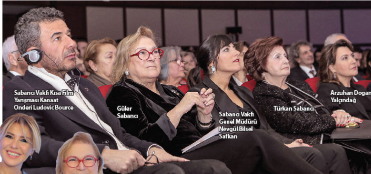
Sabancı Vakfı Kısa Film Yarışması Kanaat nderi Ludovic Bource