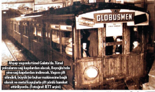
Ağşap vagonlu tünel Galata'da. Tünel yolcularının kapılarından alacak, Beyoğlu'nda yine sağ kapılardan inilecek. Vagon çift silindirik, büyük bir buhar makinesine bağlı olarak metal kayışlarla çift yönlü hareket ettirilirdi.

1875-1968 arası: Vagonlar hat değiştirilmeden aynı hat üzerinde gidip geliyor. Yolcular işi binlerce ayrı yer kullandığı için kapılar tek taraflı açılıyor. Tünelin dört vagonu da ağşap. Onedki vagonlar ikinci mekân. Kanepelerli tahtadan, ikinci mekân'de esya ve hayvan taşınabiliyor. Arkadaki vagon birinci mekân ve sadece yolcular. Birinci mekân'din kanepeleri minderli. Yasa kablolar tarafından çekilen