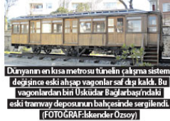
Dünyanın en kısa metrosu tünelin çalışma sistemi değışince eski ağşap vagonlar sıfırda kaldı. Bu vagonlardan bir üstükür Bağırbağındaki eski tramvay deposunun bağışlenimli sergilenildi.

(* Bu yazıda İETT'nin 136. yıl ansısına yayımladığı Tünel dergisinden yararlandım.