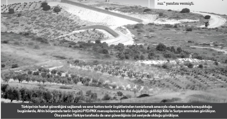
Türkiye'nin hudut güvenliğini sağlamak ve sınır hattını terör örgütlerinden temizlemek amacıyla olası hareketin konuşulduğu bugünkü, Afrin bölgesinde terör örgütü PYD/PKK mensuplarının bir diz de görüşüldüğü bildirildi. Otoyandan Türkiye tarafında da sınır güvenliğinin üst seviyede olduğu görüldü.

Gün içerisinde AA muhabirine açıklama yapan ABD öncülüğündeki DEAŞ karşıtı koalisyon sözcüsü Albay Ryan Dillon ise Türkiye'nin Afrin'de muhtemel bir operasyonunda, koalisyonun oradaki PYD/PKK unsurlarını destekleyip desteklemeyeceği sorusuna "Afrin operasyonu anlamız değil. Başta Ebu Kemal'in Kuzeyi ve Fırat Nehri'nin doğu yakasındaki alanlar olmak üzere, Orta Fırat Vadisi boyunca kalan ceplerde DEAŞ'ı yenmek üzere ortaklığımıza destek veriyoruz." yanıtını vermişti.