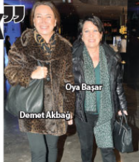
Oya Başar, Demet Akbağ

2009 yılında ÇEV (Çağdaş Eğitim Vakfı) öncülüğünde başlayan, 'Harika Yetenekler' olarak da bilinen Forte 24 Genç Yetenek' projesi, ilk günkü heyecanı ile devam ediyor. Proje yarınca önceki akşam bir alışveriş merkezinde konser düzenlendi. Genç Yeteneklerden Dev Konser' dogamı ile yola çıkan sanatçılar, sanat ve iş dünyasından önemli isimler dinlemeye geldi. Sunuculuğunda Donunay Soyser'in yapıldığı geceye, Halit Ergenç, Nur Fettahoğlu ve Meryem Uzerli gibi isimler katılarak destek oldu.