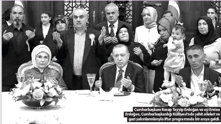
Cumhurbaşkanı Recep Tayyip Erdoğan ve eşi Emine Erdoğan, Cumhurbaşkanlığı Külliyesi'nde şehit aileleri ve gazli yakınlarıyla iftar programında bir araya geldik.

"İsrail yönetimini ikaz ettik saygıyolu olması için. Katliam başlanınca mekanizmaları harekete geçirdik. BMGK'nın bu konuyu ele alması için girişimler yaptık. Liderleri görüştüm. Bu telefon diplomasisi bu gece ve yarın sürecektir. Cuma günü İT'nin olağanüstü zirvesini topluyoruz. Bu zirveden önce Yenikapı'da dev bir miting gerçekleştireceğiz."