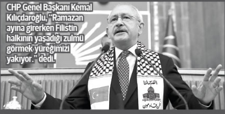
CHP Genel Başkanı Kemal Kılıçdaroğlu, "Ramazan ayına girerken Filistin halkının yaşadığı zulmu görmek yüreğimizi yakıyor." dedi.

Zaman hekimler tarafından ilk muayeneni yapıldığı ifade edilen açıklamada, Baykal için detaylı fizik tedavi ve rehabilitasyon programı planlandığı kaydedildi. Açıklamada, "İzlenecek tıbbi süreç ve alınan güvenceli tedbirleri hakkında hasta yakınları bilgilendirilmiştir. Sayın Baykal'ın genel sağlık durumu iyidir," ifadelerine yer verildi.