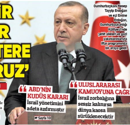
Cumhurbaşkanı Recep Tayyip Erdoğan ve eşi Emine Erdoğan, Cumhurbaşkanlığı Külliyesi'nde şehit aileleri ve gazl yakınlarıyla İftar programında bir araya geldi.

CUMHURBAŞKANI Erdoğan, Gazze'deki İsrail terörüne ilişkin, "Filistin'de büyük bir insanlık suçuna karşı karşıyayız." dedi. Erdoğan, konuşmasında, "Afin'de 4456, Kuzey Irak'ta 403, yurt içinde son dönemde 345 teröristi etkisiz hale getirdik." ifadelerini kullandı.