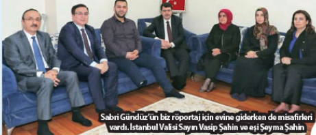
Sabri Gündüz'ün bir röportaj için evine giderken de misafirleri vardı. İstanbul Valisi Sayın Vasip Şahin ve eşi Seyma Şahin

Devletin yanında olduğumu bilmek çok güzel. Evime misafir gelmesi ise insanı daha güçlü ve yenilmez hissettiriyor. Tabii ki benim ve ailem için çok özel ve çok önemli bir gündü. Ama esas benim hafızımda kalan Cumhurbaşkanımızın bacağıma gördüğü andı. O gün yine bu pantolon ve bu gömlek üzerimdeydi. Dışarıdan bakıldığında bacağımda bir şey olduğu pantolonumun belli olmayıyordu. Ne zamanki pantolonumun paçasını sıyııp bacağıma gösterdim, Cumhurbaşkanımızın yüz ifadesi değişti. Bacağımın kesileceğini anladı ve gözünün içindeki hüznü gördüm. O ifade ömrümün sonuna kadar gözümün önünden gitmeyecek.