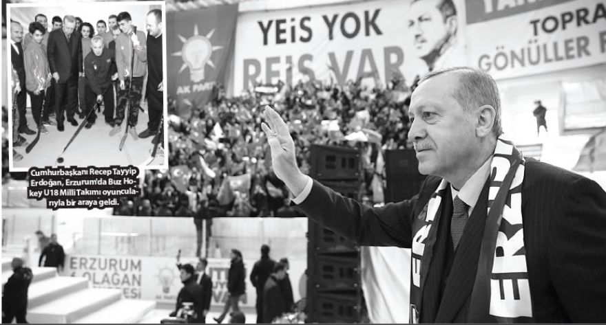
Cumhurbaşkanı Recep Tayyip Erdoğan, Erzurum'da Buz Key U18 Millî Takımı oyuncularıyla bir araya geldi.

Otoyandan Erdoğan, Ukrayna Devlet Başkanı Petro Porosenko ile telefonla görüştü.