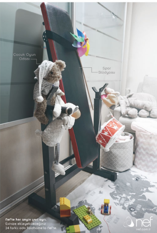
Neftçe her şeyin yarıdır. Evinize ekleyebileceğiniz 24 farklı oda. Folchome'ta Neftçe.

yüzü 'Biz kendimiz için bir şey istemiyoruz, barış gelirin.' diyorlardı. Bu sözü hep yüreğimde taşıdım ve her şeyi barış üzerine kurdum. Gücüm yettiği kadar barış için çalışacağım. Bu ülke hepimizin ülkesi, ülkeye barış getiremediğimiz için Türk halkından da Kürt halkından da özür diliyorum. Bunda bizim de sorumluluğumuz var ama şuna çok inanıyorum ki bu coğrafyada yaşayan halkların aslında birbirleriyle sorunu yok. Ne olursa olsun ölümler olmamalı, ölümleri durdurmanın yolu hep beraber aramamız gerekiyor. Barış yeniden kurma çabası içinde olmalıyız." Tuğluk'un terör örgütü üyesi olduğundan 8 yıl hapisle cezalandırılmasına hükmeden mahkeme heyeti, ceza 3713 sayılı Terörle Mücadele Kanunu'na göre yarı oranda artırarak 12 yıla çıkardı. Mahkeme, cezadan 1/6 oranında indirimi yapmasına karar vererek Tuğluk'un 10 yıl hapisle cezalandırılmasına hükmetti.