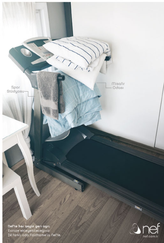
Spor Stüdyosu Misafir Odası

Anadolu Efes, genç tiyatrolar ile tiyatroya toplulukları desteklemek ve tiyatroseverleri bir araya getirmek amacıyla Anadolu Efes Mavi Sahne ad altında bir kültür-sanat platformuna imza atıyor. Anadolu Efes Mavi Sahne, 14 Mart Çarşamba günü üniversite tiyatroya topluluklarının da katılımı ile B Plan'ın sahnelendiği "Yuva" oyunuyla perdelerin açtı. Sezon sonuna kadar her Çarşamba genç tiyatrolardan oyunları DasDas'ta yer alan Anadolu Efes Mavi Sahne'de sahnelenecek. 1992 yılından bu yana Türkiye'de tiyatromun en büyük destekçilerinden olan Anadolu Efes, oyunlarını sergilemek için sahne ihtiyacı çözen genç tiyatrolulara Anadolu Efes Mavi Sahne ile yeni bir platform sağlayarak, genç tiyatrolular ile tiyatroseverleri bir araya getirecek. Yürümün dışında Kayıp El (DasDas), İstila (B Plan), Berlin Zamanı (Platform) ve Çok Satılan (Sanat Matral-DasDas) in sahne alacağı Anadolu Efes Mavi Sahne'de her oyun için sadece üniversite öğrencilerinin girebileceği özel gösterimler de yapılacak. Anadolu Efes Mavi Sahne'nin tüm oyun programı ve bileti DasDas girişinden ve www.biletix.com adresinden temin edilebilir.