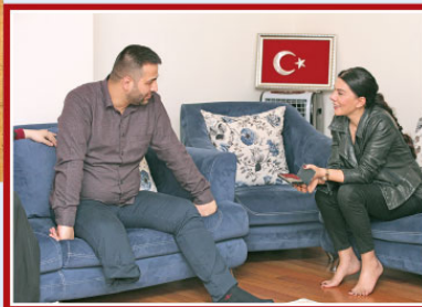
■ Cumhurbaşkanımızın sizi ziyaretini herkes biliyor ve konuşuyor. Her dakikası özel olan o ziyaretin sizin için en unutulmaz anı bize de anlatır mısınız?

“Darbeden sonra ilk bayramımdı. Bacağımı bakıp kendime üzülüyordum... Sonra hayatımda hiç olmadığım kadar kendimden tik-sindim ve utan-dım. Nice şehit çocuğu babasız bayram geçirecek. Ben bu halde olduğum için mi üzülüyorum dedim. O an kendimi toparlamaya karar verdim. Onları bu hallere düşürenlere tek bedduam var. Allah Fetöçü-lere töbe etme fırsatı vermesin!