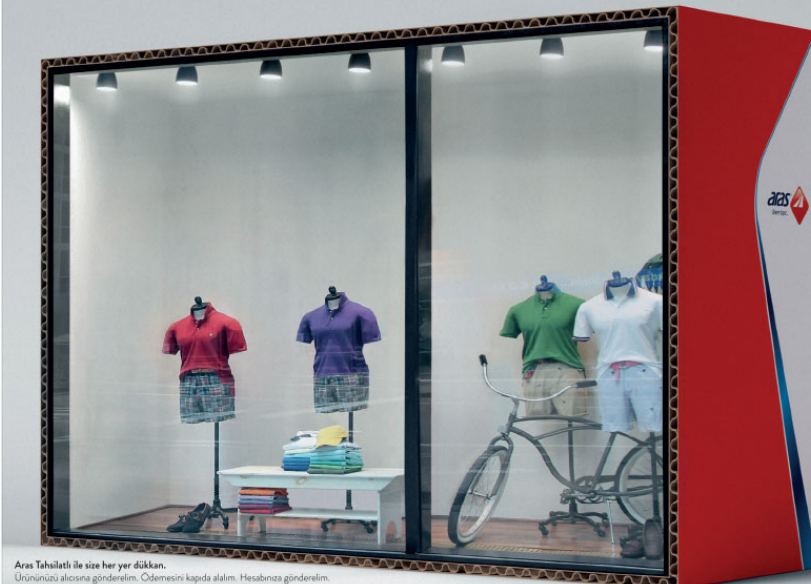
Aras Tahsilatı ile size her yer dükkan. Ürünümüzü alıcınıza gönderelim. Ödemeyi kapıda alalım. Herabınıza gönderelim.