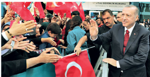
'KİMSE TÜRKİYE'NİN BİLEĞİNİ BÜKEMEZ'

"Artık terörü Güneydoğu'da, Doğu'da büyük oranda hallettik. Ne diyorlar? Kürtler... Kardeşim öyle bir şey getiriyorlar ki, YPG ile PYD'yi Kürt' diye tanımlıyorlar. Şimdi bu bir defa benim Kürt vatandaşlarımızı saygısızlıktır. YPG ile PYD'yi Kürt' diye tanımlamak saygısızlığın daniskasıdır, onlar teröristtir. Teröristlerle Kürt kardeşlerimizi birbirine karıştırmayalım. Hep söylüyorum, benim şu anda parlamentodaki grubumun içerisinde 50 Kürt milletvekilim var. Bizim böyle bir ayırmamız yok. Niye yok? Çünkü biz Kürt'üyle, Türk'üyle, Laz'ıyla, Çerkez'le, Gürcü'yle, Abhaz'yla vellehisi yaratılan Yaradan'dan ötürü sevdi. Biz de böyle bir ayırım yok."