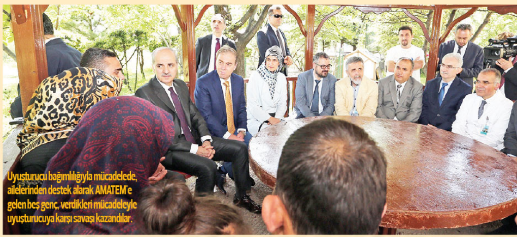
Uyuşturucu bağımlılığıyla mücadelede, ailelerinden destek olarak AMATEM'e gelen beş genç, verdikleri mücadeleye uyuşturucuya karşı savası kazandılar.