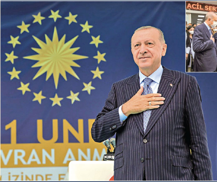
Türkiye Cumhurbaşkanı Recep Tayyip Erdoğan, Kırşehir'de Musa Gül Hastanesi'ni ziyaret edip sağlık çalışanlarıyla bir araya geldi.

"GEÇTİĞİMİZ yıl şeker pancarı üretiminde 23 milyon tonla Cumhuriyet tarihinin rekorunu kırmıştık. İnşallah bu yıl da bereketli bir sezon geçireceğimize inanıyoruz. Şeker pancarının alım fiyatını, geçtiğimiz yıl ton başına 336 lira olarak belirlemiştik, bu yılki şeker pancarı alım fiyatımız ton başına 420 liradır. Yüzde 25'lik bir artış ifade eden şeker pancarı alım fiyatımızın ülkemize ve çiftçilerimize hayırlı olmasını diliyorum."