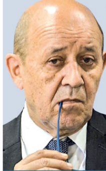
Fransa Dışişleri Bakanı Le Drian, Avustralya'nın Fransa savunma endüstrisi için "yüz yılın anlaşması" diye de geçen 90 milyar dolarlık 12 nükleer enerji denizaltı alım anlaşmasını iptal etmesi hakkında "sirtimizden vurulduk" dedi.

Avustralya'nın Adelaide kentinde yapılması planlanan projenin sona ermesine tepki gösteren Fransız Naval Grubu, Avustralya hükümetinin projeyi rafa kaldırmasıyla hayal kırıklığına uğradığını bildirdi.