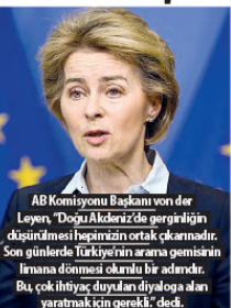
AB Komisyonu Başkanı von der Leyen, "Doğu Akdeniz'de gerginliğin düşürülmesi hepimizin ortak çıkarıdır. Son günlerde Türkiye'nin aramaya girmesi insani dikkate alınmalıdır. Bu, çok ihtiyaç duyulan diyaloga alan yaratmak için gerektirir" dedi.

AB'nin tek pazar önündeki engelleri kaldırması, bürokrasini azaltması ve malların, hizmetlerin, sermayenin ve insanların hareket özgürlüğünü yeniden tesis etmesi gerektiğini vurgulayan Von der Leyen, "Şenghen sisteminin geleceği için yeni bir strateji önereceğiz" dedi. Diş politikası