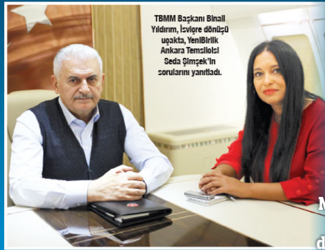
TBMM Başkanı Binali Yıldırım, İsviçre dönüşü uçağında, Yeni Birlik Ankara Temsilcisi Seda Şimşek'in sorularını yanıtladı.

TBMM Başkanı Binali Yıldırım, "İş Bankası'nın sürekli tartışmalarla anılması da hoş bir şey değil. Bu konuda partilerin bir araya gelip uygun bir çözüm bulması gerekir. Meclis Başkanlığı'na gelirse biz de bunu değerlendiririz" dedi.