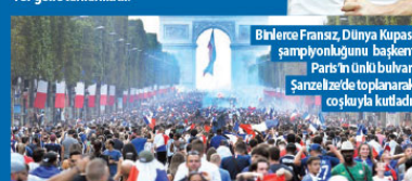
Bir önce Fransa, Dünya Kupası şampiyonluğunu başkent Paris'te ünü bulmuş Şanzelize'de toplanarak coşkuyla kutladı.

Fransa'nın şampiyonluğu ile tamamlanan FIFA Dünya Kupası'nda en golcü isim de belli oldu. İngiltere'nin yan finalde kadar çıkmasında büyük rol oynayan Kane turnuvarın gol kralı oldu. Yıldız futbolcu, G. Grub'ündeki 6-1'lik Panama zafere de katkıları ile 3 kez havalandı. Grubun diğer maçında Tunus'a 2 gol kaydeden 24 yaşındaki futbolcu, son golünü ise 16 turundaki Kolombiya müsabakasında attı. Belçikalı Romelu Lukaku, Denis Cheryshev ve Cristiano Ronaldo da turnuvayı 4'er golle tamamladı.