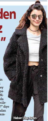
Haber: Ulaş Aydın

UZUN zamandır ortalarda gözükmeyen Beren Saat önceki gün Nişantaşı turunda ortaya çıktı. Buz gibi havaya rağmen göbeğini açta burakan tiyatroyla dikkat çeken oyuncu, gazetecilerin sorularını ise "Bugün beni mazur görün. Ne olur bir şey sormayın. Alışverişimi yapayım" diyerek geri çevirdi. Nişantaşı'nın ara sokaklarında karşısında gördüğü gazetecilere "Nereden çıktınız böyle?" diye gülerek taklan Saat, ardından gündüğü bir iç çamaşır mağazasından iki çift çorap aldı.