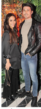
50 BİN DOLARLIK EVLİLİK SÖZLEŞMESİ