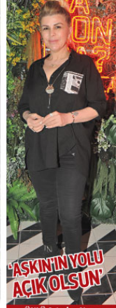
'AŞKININ YOLU AÇIK OLSUN'