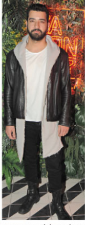
'AŞK HAYATIM İYİ GEÇMİYOR'

GÜZEL şarkıcı İtalya'da yaşayan sevgilisi ile covid-19 virüsü yüzünden görüşemediğini ve erkek arkadaşının sağık durumunun iyi olduğunu ilk kez açıkladı. Zorlu, "İtalya'da her şey durdu. Benim içinde durdu. Maalesef görüntülemiyorduk. İnternet üzerinden görüşüyorduk. Yaklaşık 2 ay önce başladı. Bütün gün evde bir hava almak için dışarı çıkıyor. Sağlık durumu iyi" dedi.