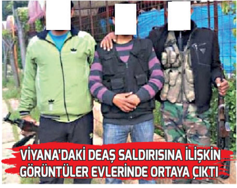
VİYANA'DAKİ DEAŞ SALDIRISINA İLİŞKİN GÖRÜNTÜLER EVLERİNDE ORTAYA ÇIKTI

Ankara'da keşif ve istihbarat çalışması yaptıkları tespit edilen yabancı uyruklu 2 terörist, Emniyet ve MIT'ten ortak operasyonu yakalandı. Adliye sevk edilen 2 şüpheli tutuklandı