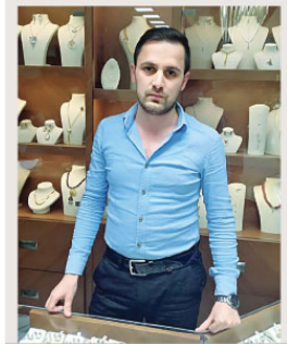
Balona rövesata atan adam