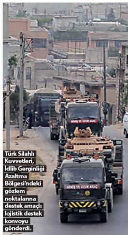
Türk Silahlı Kuvvetleri, İdlib Gerginliği Azaltma Bölgesindeki gözlem noktalarına destek amaçlı lojistik destek konvoyu gönderdi.

TSK, İdlib Gerginliği Azaltma Bölgesindeki gözlem noktalarına takviye amaçlı çok sayıda tank, zırhlı personel taşıyıcı, ağır silah ve personelden oluşan askeri konvoy yolladı.