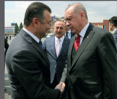
Türkiye Cumhurbaşkanı Recep Tayyip Erdoğan, Tacikistan Cumhuriyeti'nin başkenti Duşanbe'de, Asya'da İşbirliği ve Güven Artırıcı Önlemler Konferansı (CICA) 5. Devlet ve Hükümet Başkanları Zirvesi'ne katıldı. Cumhurbaşkanı Erdoğan, Duşanbe Uluslararası Havaalanı'ndan Tacikistan Başkanı Kohir Rasulzoda tarafından uğurlandı.

Asya'da İşbirliği ve Güven Artırıcı Önlemler Konferansı'nın dünyamız için hayırlara vesile olmasını diliyorum. Başta ev sahibi Tacikistan olmak üzere tüm üye ülkelerin devlet ve hükümet başkanlarına bu önemli platforma vermiş oldukları destekten dolayı teşekkür ediyorum."