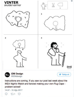
Dizinin kostüm tasarımcılarından Michele Clapton, Los Angeles'teki Getty Müzesi'nde yaptığı açıklamada, Game of Thrones dizisindeki karakterlerin giydiği kürk pelerinlerin aslında IKEA kilimleri olduğunu söyledi.