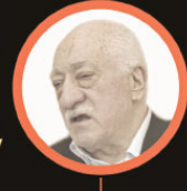
FETULLAH GÜLEN FETÖ Elebaşı

Darbe girişimine aylar öncesinden hazırlanan FETÖ, 15 Temmuz gecesi beklediği gelişmeler karşısında unutulmayacak bir hezimet yaşadı