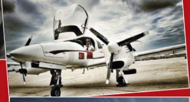
TÜRKİYE-İRAN SINIRINDA GÜN DOĞUMU...