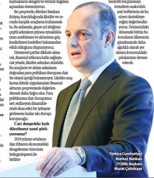
Türkiye Cumhuriyet Merkez Bankası (TCMB) Başkanı Murat Çetinkaya