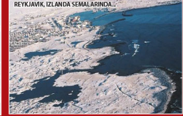
REYKJAVIK, İZLANDA SEMALARINDA...