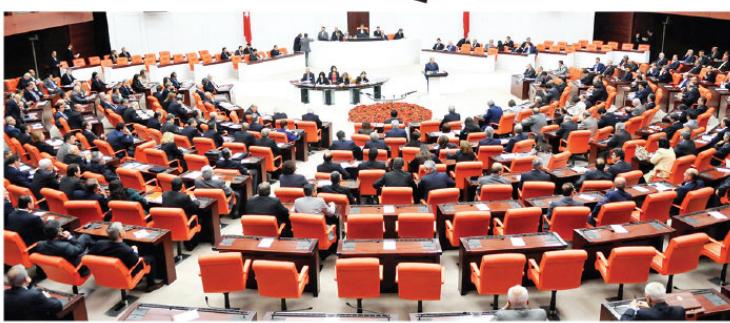
Cumhurbaşkanlığı Hükümet Sistemi'nin ilk TBMM Başkanı Binali Yıldırım'ın, 18 Şubat itibarıyla görevinden istifa edeceğini açıklaması üzerine Meclis takvimi yeniden şekillendi.

Cumhurbaşkanı Erdoğan ile AK Parti'nin kuruluş aşamasında görev alan Yıl-