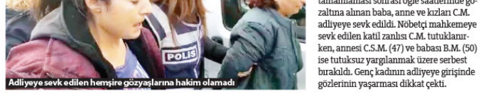
Adliye sevk edilen hemşire göz yaşlarına hakim olamadı