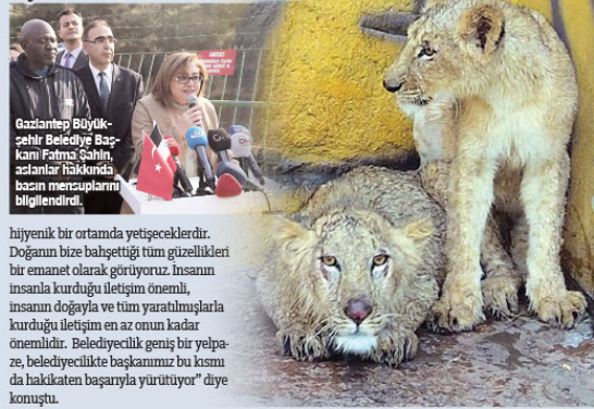
Gaziantep Büyükşehir Belediye Başkanı Fatma Şahin, aslanlar hakkında basın mensuplarını bilgilendirdi.

AK Parti Şehir ve Kültürden Sorumlu Genel Başkan Yardımcısı Çiğdem Karaslan ise Cumhurbaşkanı Recep Tayyip Erdoğan'a hediye edilen aslanların Sudan ile Türkiye arasındaki kardeşliğin bir sembolü olacağını bildirdi. "Reisin aslanları Gaziantep'te sağlıklı