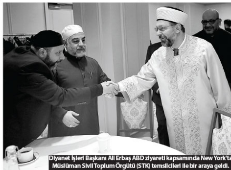
Diyaret İşleri Başkanı Ali Erbaş ABD ziyareti kapsamında New York'ta Müslüman Sivil Toplum Örgütü (STK) temsilcileri ile bir araya geldi.

Dünyanın bir tarafında her 3,5 saniyede bir insanın açlıktan öldüğüni, diğer tarafta ise her 3,5 saniyede çok yemekten ölen insanların olduğu örneğini veren Erbaş, Müslümanların