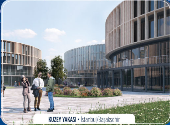
KUZEY YAKASI • İstanbul/Başakşehir