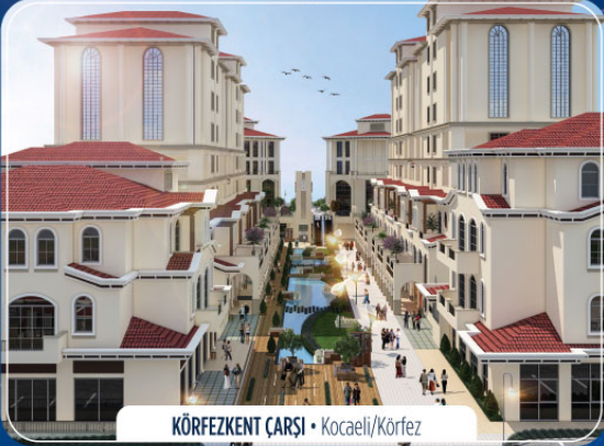
KÖRFEZKENT ÇARŞISI • Kocaeli/Körfez