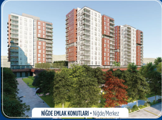
NİĞDE EMLAK KONUTLARI • Niğde/Merkez