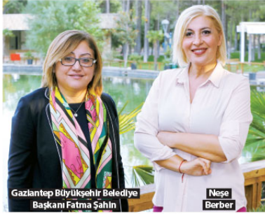
Gaziantep Büyükşehir Belediye Başkanı Fatma Şahin

Şehirde futbol yaşamını amatör kulüpler olarak sürdüren ve stadyum problemi yaşayan kulüpler için, 2 adet profesyonel Türkiye Futbol Federasyonu standartlarında futbol sahası ve 600 kişilik tribün yapılacak. Uygulama projeleri hazırlandı.