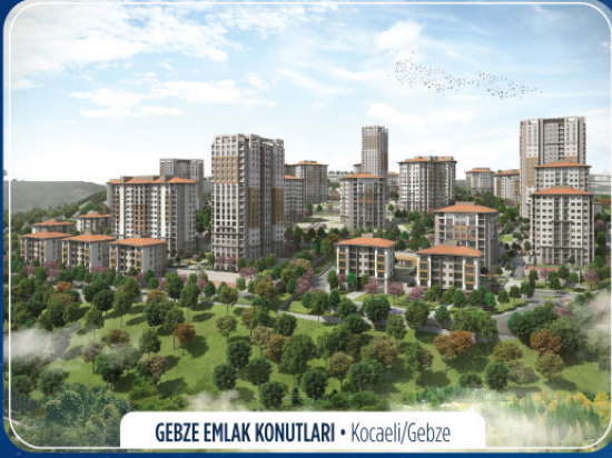
GEBZE EMLAK KONUTLARI • Kocaeli/Gebze