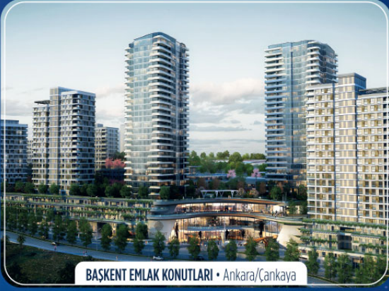
BAŞKENT EMLAK KONUTLARI • Ankara/Çankaya

Emlak Konut'un prestijli projelerinden uygun ödeme koşullarıyla konut ve ticari ünite sahibi olmak için siz de satış ofisimize gelin yatırımlarınızı ertelemeyin.