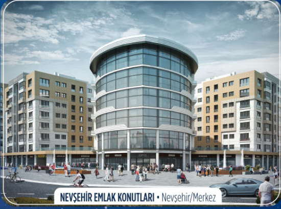
NEVŞEHİR EMLAK KONUTLARI • Nevşehir/Merkez